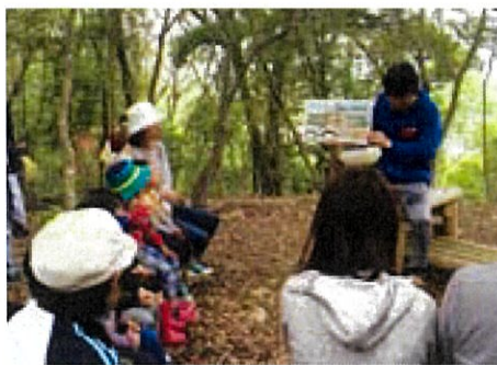
大学生のお兄さんが読み聞かせをしてくれました!