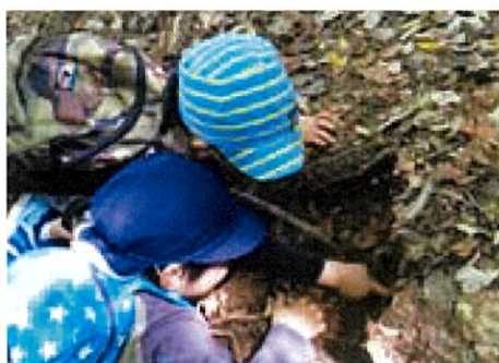
何を見つけたかな～?

5月7日(日)は親子15組43人が参加して、森での遊びや木工体験を楽しみました。