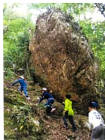
坂道もどんどん登っていくよ!